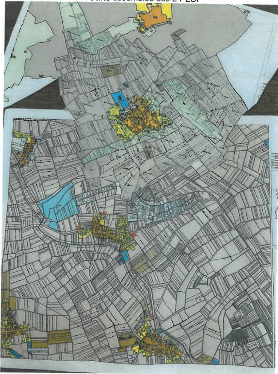
Carte assemblée des 2 PLUi

La zone N la plus au sud, ne correspond pas à la localisation du cours d'eau de la zone N du PLUi du pays de la Zorn (s'agit-il d'une erreur?).