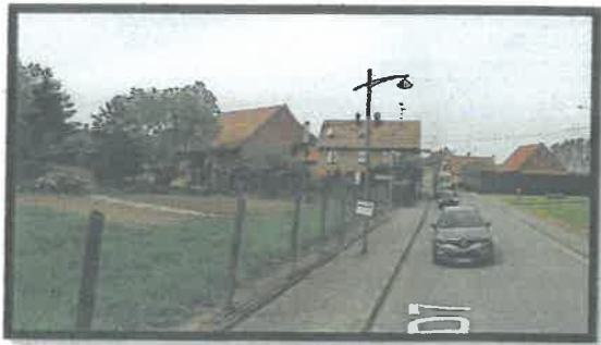
Emplacement BOS04-BOS08 VISION SORTIE VIRAGE