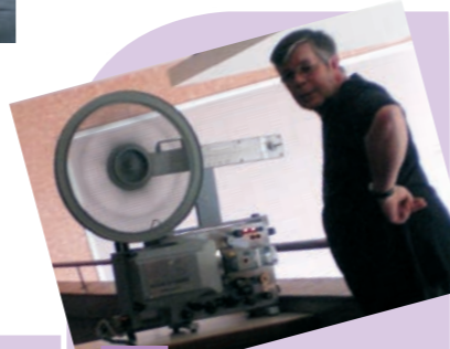
Projection cinéma du film 'Gadjo Dilo' du réalisateur Toni Gatlif le jeudi 21 mai au Foyer Sts Pierre et Paul à Hochfelden. Précédé d'un débat sur la condition et les racines des tziganes

Avec plus de 600 spectateurs sur l'ensemble du festival, cette première édition constitue une action structurante pour le projet culturel du territoire.