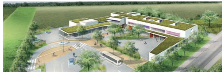
Maquette du groupe scolaire intercommunal

Les écoles de notre territoire fonctionnent majoritairement en Regroupement Pédagogique Intercommunal. A titre d'exemple, 21 communes sont rattachées à un groupement d'école.