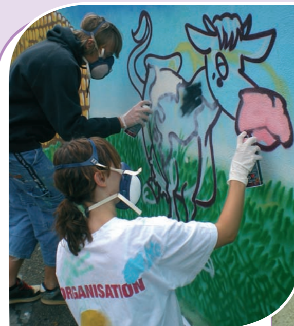
De la peinture... De la passion, de l'engagement... De l'investissement, de la créativité...