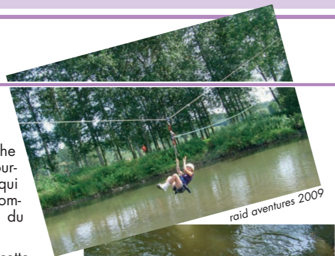
raid aventures 2009