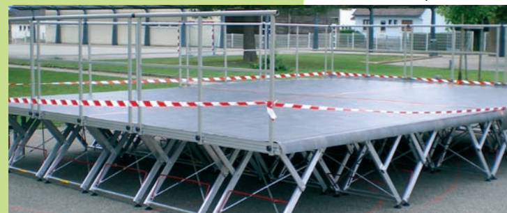
Praticables avec escalier et garde-corps