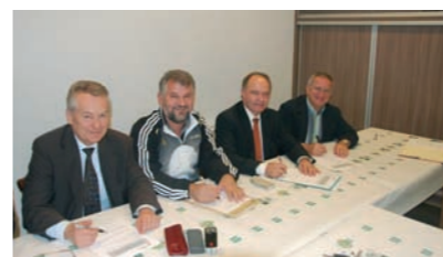
Signature de la convention

Les travaux de construction du terrain de football en gazon synthétique avec club house et vestiaires se sont achevés à Ettendorf. L'aire de jeux, praticable à tous temps et idéalement située, offre aux joueurs la possibilité d'évoluer dans un lieu adapté. Quant au bâtiment, d'une superficie de 550m 2 , il comprend 4 vestiaires, une infirmerie, un bureau, une buanderie, des locaux de rangement et un club house.