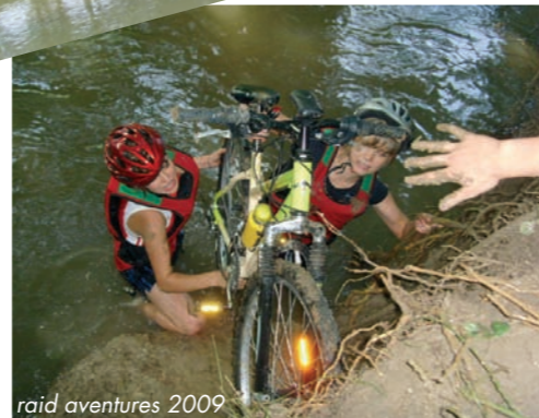
raid aventures 2009