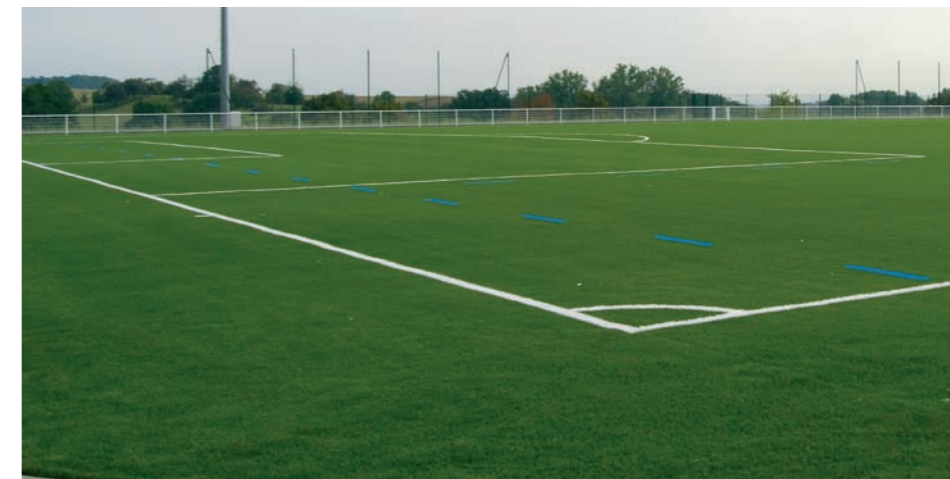
Terrain de foot synthétique à Ettendorf

L'inauguration est prévue au printemps 2010.