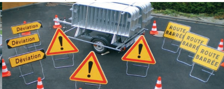
Barrières de sécurité et panneaux routiers

L'ensemble de ce matériel peut être mis à disposition des écoles, des associations et des communes du Pays de la Zorn