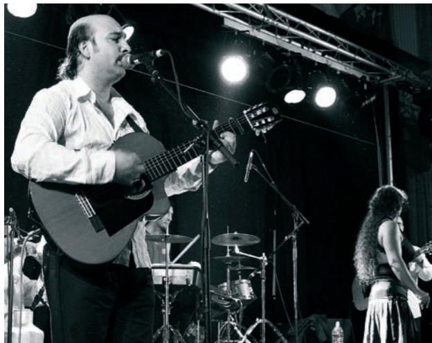
'Romano Drom' groupe de musique traditionnelle tzigane de Hongrie aux guitares entraînant et aux voix chargées d'émotion

Concert événement à la salle polyvalente de Schwindratzheim après l'installation de 3 tonnes de matériel scénique par 3 techniciens et beaucoup de bénévoles.