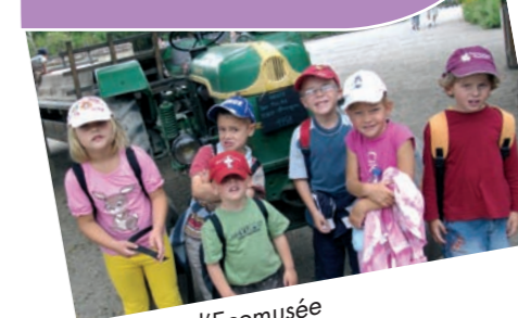
Sortie à l'Ecomusée

• A schwindratzheim Tél. 03 88 02 26 15 Mail : periscolaire.schwindratzheim@alef.asso.fr