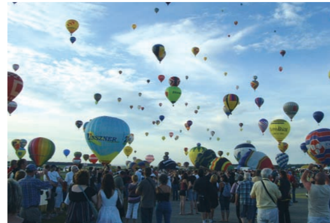
Été 2009: 11 jeunes du Pays de la Zorn et de Hanau sont partis remplir des missions d'organisation au Mondial air ballon de Chambley /// responsabilité-engagement.

nouissement de la jeunesse, les acteurs du PTJ ont décidé de créer 3 commissions: 1)inter-associatives, 2)culturelle et 3)environnementale. La commission inter-associative s'est déjà donné comme perspective pour septembre 2010 de réaliser un événement festif présentant le potentiel associatif du pays de la Zorn. La commission