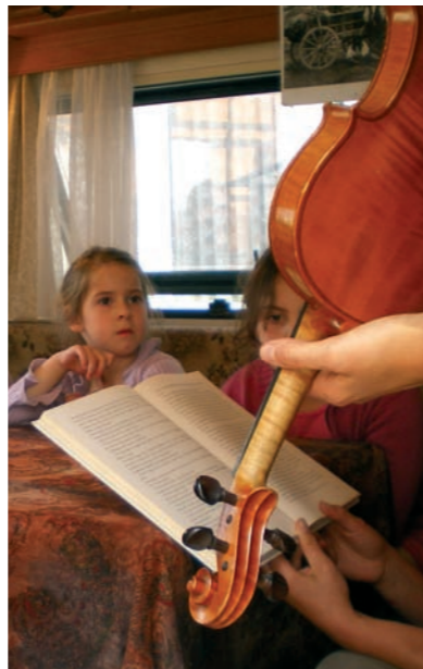
Le conte pour les enfants dans la caravane tzigane laisse les enfants rêveurs