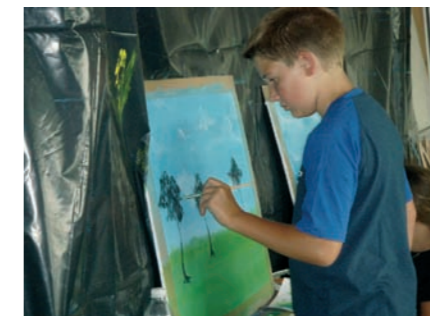
Été 2009 à Schwindratzheim: Des découvertes de pratiques artistiques faisant apparaître de réelles compétences et naître des vocations

Appel à volontaires: toute association ou personne voulant s'intégrer dans ces différentes commissions et préoccupée pour développer des actions éducatives sont les bienvenues à tout moment.