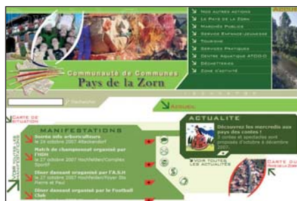
Site Internet du Pays de la Zorn

règlementaires...), de gérer son agenda, d'enregistrer les courriers... tous documents jugés nécessaires peuvent être mis sur le Portail.