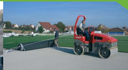
Réalisation du terrain de football