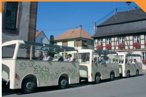
Le petit train touristique