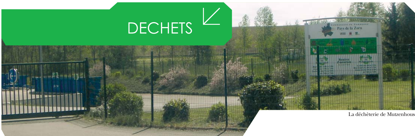
La déchetterie de Mutzenhouse

La compétence protection et mise en valeur de l'environnement a été transmise du SIVOM de Hochfelden à la Communauté de Communes dès sa création.