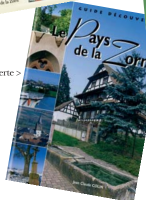
Guide découverte >