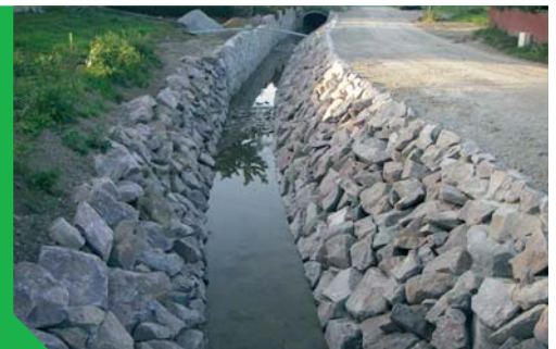
Fossé du landgraben à Ettendorf