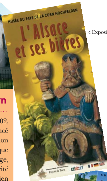
< Exposition 2007

Présente dès l'ouverture du musée en 2002, la Communauté de Communes a commencé son soutien d'investissement par l'acquisition de matériel muséographique. Depuis, chaque année, l'exposition temporaire change, mais le soutien qu'apporte la collectivité à l'ARCHE reste fidèle à son devoir de soutien à toute initiative favorisant le développement touristique. Au fil des années, un véritable travail de partenariat a permis l'accueil d'un public de plus en plus nombreux et intéressé par les thématiques très différentes, mais aussi par l'exposition permanente.