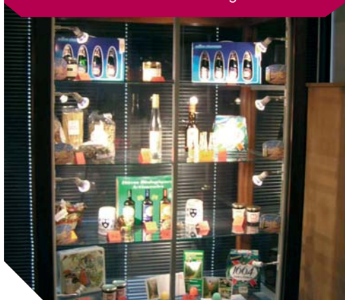
Boutique du Sentier Houblonnier