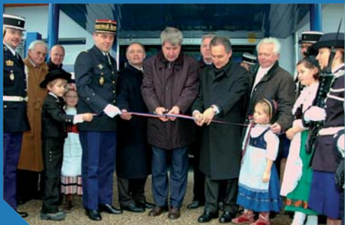
Coup de ruban lors de l'inauguration

En 2003, la compétence "construction et gestion locative d'une caserne de gendarmerie" a été adoptée par la Communauté de Communes.