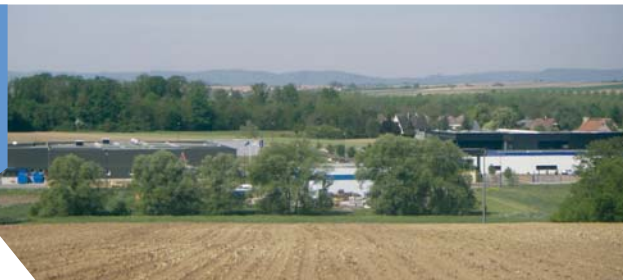
La Zone d'Activités du Canal