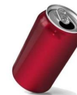
Canette 100 ans