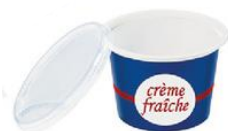
Pots de crème