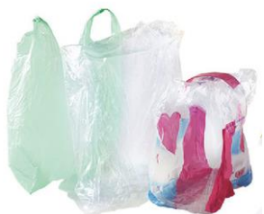
Sacs et films plastiques

Les déchets ci-dessous ne vont pas dans le bac de tri