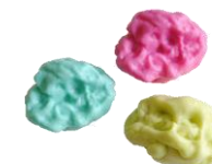
Chewing-gum 5 ans