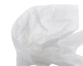
Mouchoir 3 mois