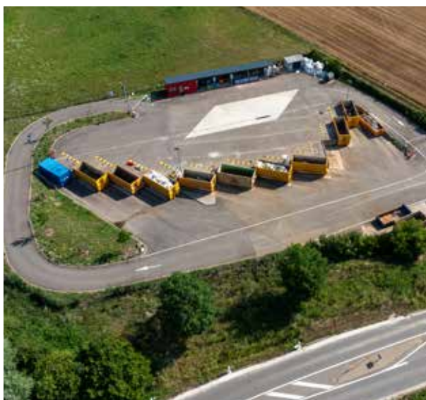
Déchèterie de Bossendorf

beaucoup de nos concitoyens. Malheureusement, nous constatons encore trop souvent des déchets jetés en pleine nature par des personnes sans scrupules et irrespectueuses de l'environnement.