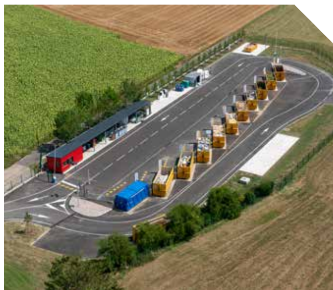
Déchèterie de Mutzenhouse